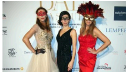
Bal Masque Maskenball

Themen: Bal Masqué Ball Charity Jenny Falckenberg Museum für Kunst und Gewerbe Stefanie Stoltzenberg